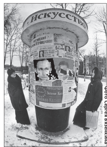
Искусство давать обещания. А выполнять?