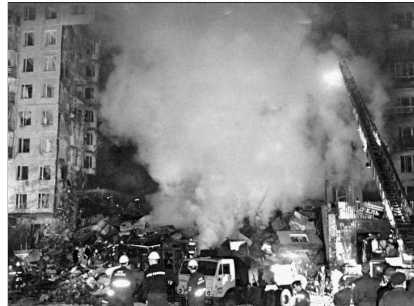
РЕЙТЕР / ГЛАЗ СТОЛИЦЫ

Мы знаем причины этой войны. Исходной, базовой причиной является, к сожалению, бедность, нищета, огромное количество безработных, отсутствие каких бы то ни было социальных программ.