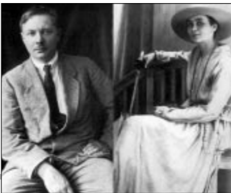
Линия персональная экспозиция после 1980-го года.

Сергей Дягилев открыл талант Михаила Ларионова. В 1906 г. Ларионов показал семь своих работ на выставке "Мир искусства", устроенной Дягилевым, и это было первой вершиной в карьере молодого художника. Дальше Ларионов двинулся сам. Начиная с выставки "Стефанос" в 1908 г. он сам был куратором своего успеха: не только писал картины, но и организовывал выставки, писал декларации, устраивал скандалы. Дягилев же был виновником того, что великодушная пара — Ларионов и Гончарова — покинула Россию. Сергей Дягилев и Игорь Стравинский пригласили их в 1915 году работать для "Русских балетов". В промежутке между этими датами — расцвет творчества Гончаровой и Ларионова.