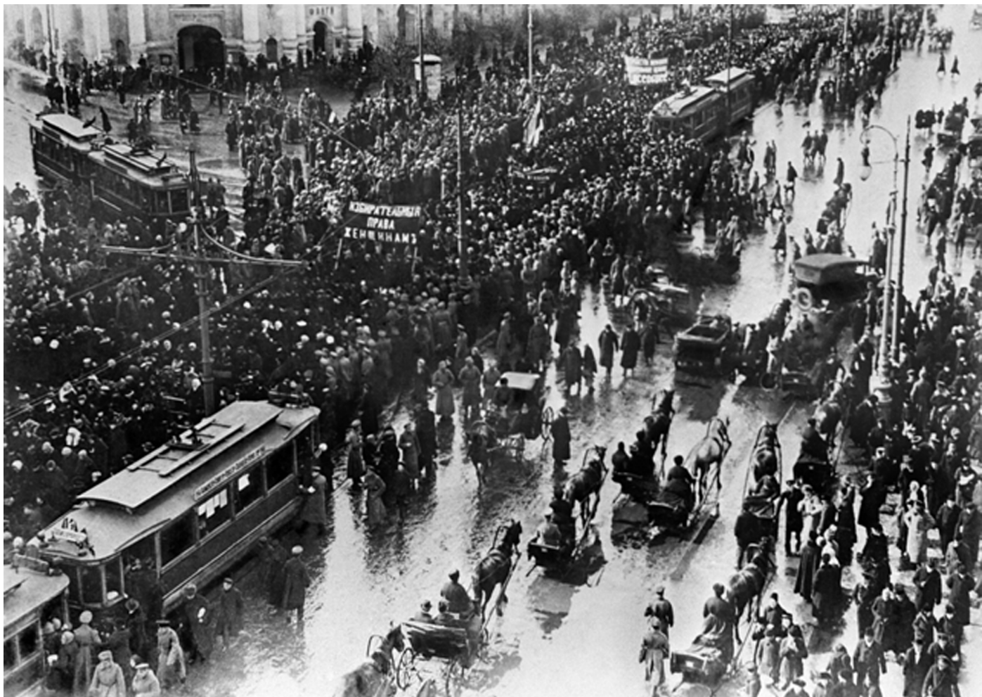
Манифестация женщин, требующих избирательных прав. 1917 год.

Гендерное угнетение — как бесцветные колготки. Или суслик из популярной кинокартины конца 90-х. Никто его не видит, а оно есть. Только в отличие от колготок, суслика и даже бога, в которого все готовы поверить, не требуя доказательств, гендерное угнетение может прийти на вашу кухню, сесть за стол и потребовать борщ. Но и в этом случае большинство людей не будет готово принять его как факт.