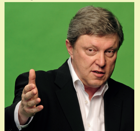
Григорий ЯВЛИНСКИЙ, Основатель Партии ЯБЛОКО, Доктор экономических наук, Профессор НИУ «Высшая школа экономики», Депутат Законодательного Собрания г. Санкт-Петербурга, Председатель Экспертного совета по экономическим реформам НЭА.

Однако власти города агрессивно противодействовали появлению достойных людей в избирательных