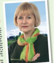
Она была первой женщиной-руководителем в Чудово...