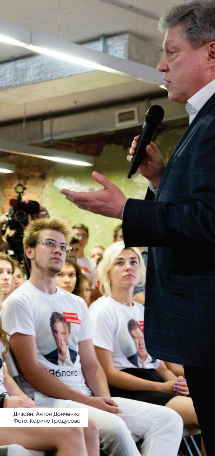
Дизайн: Антон Донченко