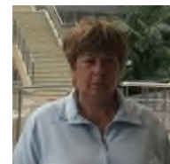
Бывший работник предприятия, акционер ЗАО «Истро-Сенежское ППО»

Мы боремся дальше. Мы будем бороться до тех пор, пока не получим то, что заслужили, и до тех пор, пока мошенники не ответят по закону.