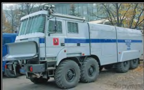
ДЕМОКРАТИЗАТОРМОБИЛЬ сеятель толерантности

- Нет. Были бы нужны поправки во «внутренние» главы, например, об импичменте, ограничении прав президента, надо принять закон об администрации президента, чтобы сделать ее чисто служебным органом. Потому что сейчас администрация