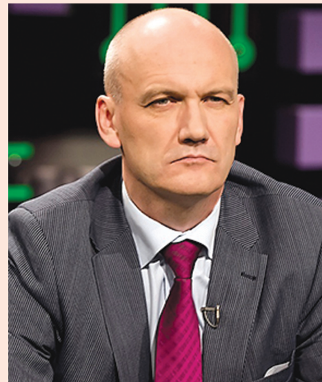
Автор Игорь НИКОЛАЕВ, ЭКОНОМИСТ

Новость о резком ухудшении динамики промышленного производства — минус 4,5% в годовом выражении — стала, чувствуется, большим сюрпризом для властей. Как же, цены на нефть подросли, рубль окреп, а тут такое?