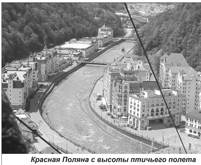
Красная Поляна с высоты птичьего полета

прошли реабилитацию около 100 сотрудников силовых структур. Одни из них участвовали в боевых действиях на Северном Кавказе, другие пережили потерю близких, а у третьих были трудности с адаптацией к службе.