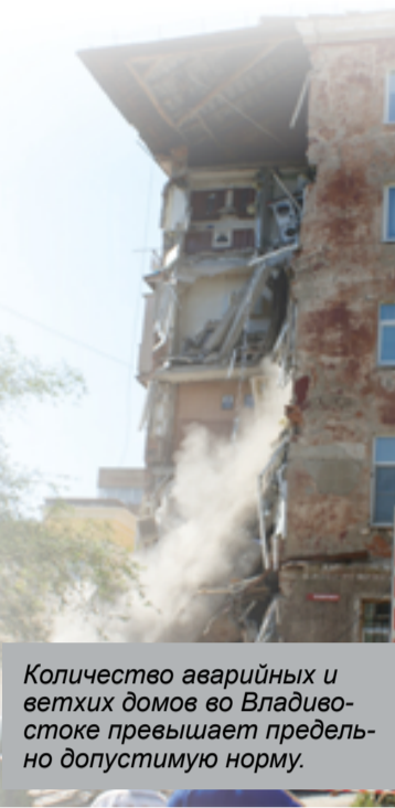
Количество аварийных и ветхих домов во Владивостоке превышает предельно допустимую норму.

P.S. Все совпадения в названиях стран, городов, учебных заведений, надзирающих органов, имён, фамилий, избранных и других фактов, упомянутых в статье, считать случайными. История эта выдуманная и не соответствует современным реалиям нашего правового государства. И мэры с губернаторами у нас не казнокрады и не состояли раньше в бауловских, винни-пуховских и других преступных группировках. И с выборов не снимают по беспределу, не фальсифицируют их. А то, что ранее Приморским регионом руководило неустановленное лицо и в администрации края, под носом у чекистов Ролика и Лося, пропадаю целые теплоходы, – так это случайно. Всего вам доброго. Берегите себя.