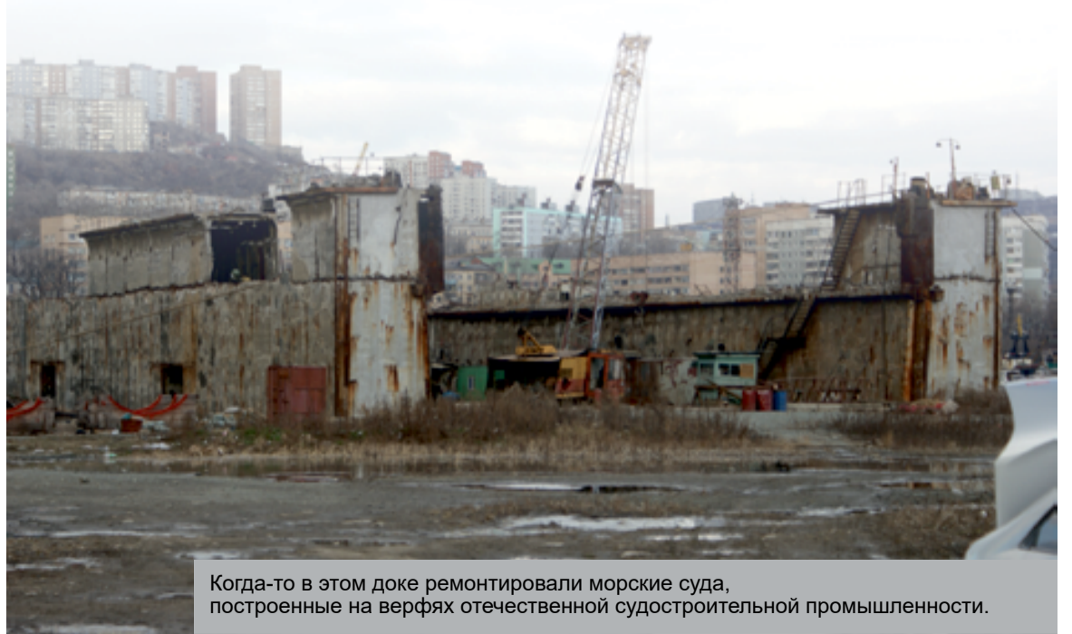
Когда-то в этом доке ремонтировали морские суда, построенные на верфях отечественной судостроительной промышленности.