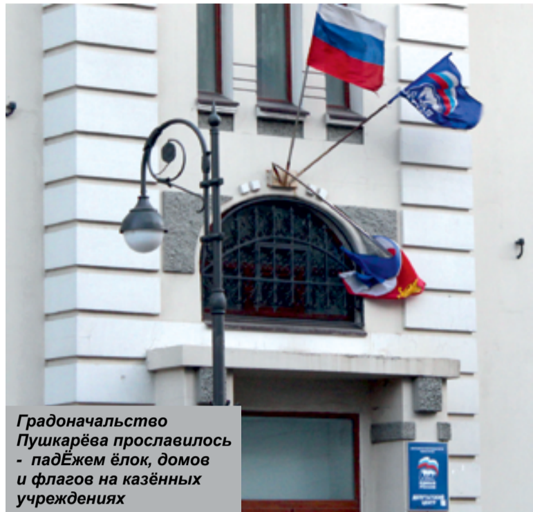
Градоначальство Пушкарёва прославилось - падёжем ёлок, домов и флагов на казённых учреждениях

то есть почти четверть миллиарда долларов. Ещё, конечно, не долларовый миллиардер, но уже, бесспорно, миллионер. Каково состояние Пушкарёва сегодня, нам доподлинно не известно, но, думаем, под миллиард долларов в копилке у героя есть. А возможно, есть и шубохранилище для любимых шуб жены, как у другого российского государственного деятеля, главы РЖД Владимира Якунина, чья зарплата составляет 2,7 миллиона рублей в день. Это, конечно, не 4,5 миллиона, как у другого чиновника – главы Роснефти Игоря Сечина, но всё же жить можно... Почему предисловие к статье такое странное? Обычно наши люди не любят читать предисловий, а жаль. Поскольку, только прочитав предисловие, можно понять всю сущность и нравственность героя нашего времени Пушкарёва. Догадаться, почему такие пройдохи занимают серьёзные государственные должности в современной России. Ведь наша нынешняя публика похожа на провинциала, который, услышав очередные обещания перед выборами от партии жуликов и воров, верит им.