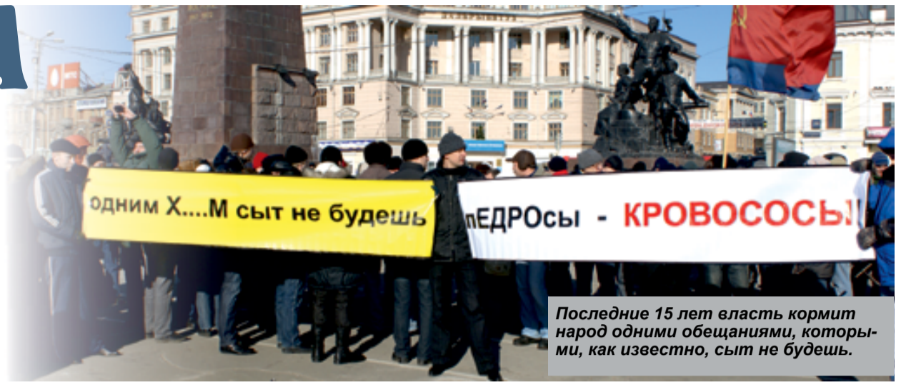
Последние 15 лет власть кормит народ одними обещаниями, которыми, как известно, сыт не будешь.

Взгляд из глубинки на фильм Андрея Звягинцева «Левиафан»