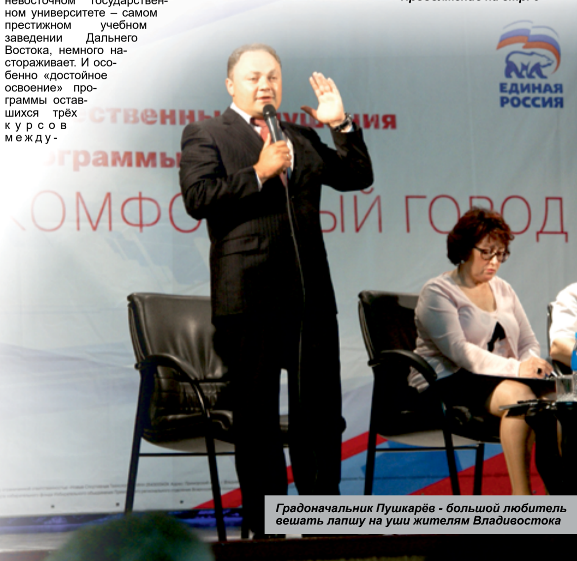
Градоначальник Пушкарёв - большой любитель вешать лапшу на уши жителям Владивостока