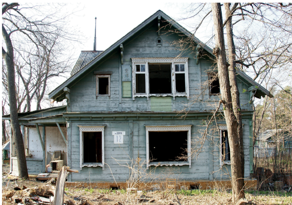
Это здание бывшей «Восточной школы», по версии следствия, продано преступным сообществом (ОПС), с использованием мошеннических схем. Организатором и руководителем этого преступного сообщества является неустановленное следствием лицо, которое работало в администрации Приморского края высшим должностным лицом Приморского края, руководителем высшего исполнительного органа государственной власти Приморского края — администрации Приморского края.