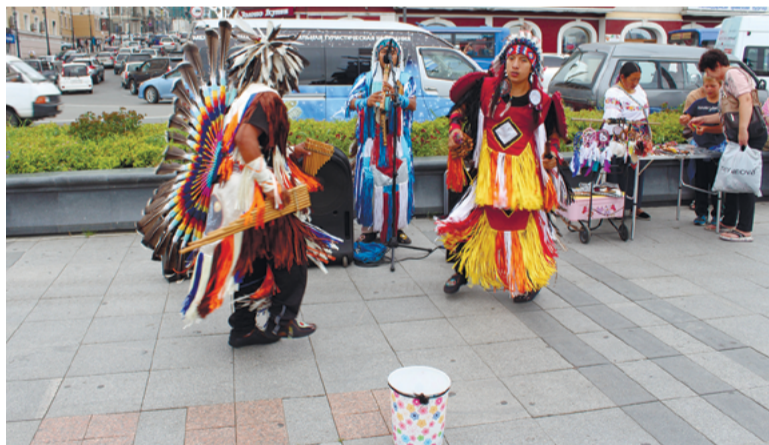
Американцы уже пришли, а Путин остался.

Недавно в очередной раз я убедился в популярности национального лидера и широкой поддержке его политики.