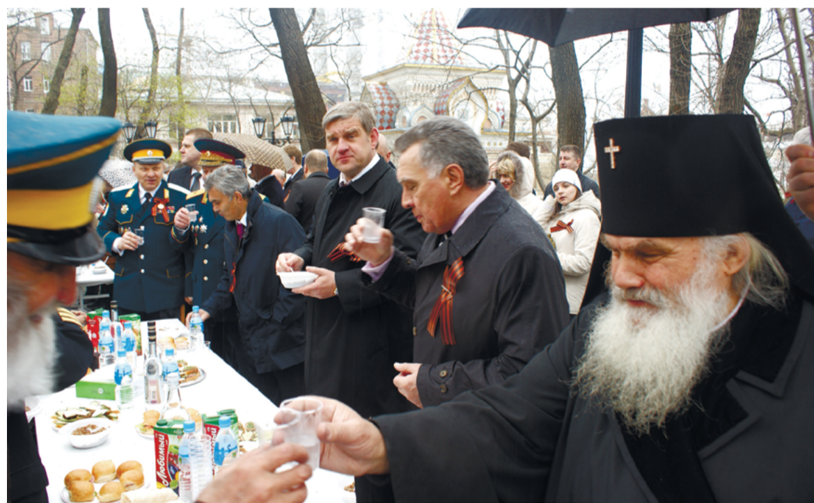
Сергей Дарькин: - «Вы не согласны с нашим правосудием? Тогда обращайтесь в наш суд?»

сокопоставленных чиновников, бухгалтеров и прочих неустановленных лиц. И это преступное сообщество уважаемых людей «в процессе общения и неоднократных встреч с неустановленным лицом вступило в преступный сговор на приобретения путём мошенничества, скрытно от общества, объектов государственного недвижимого имущества по заниженным ценам.