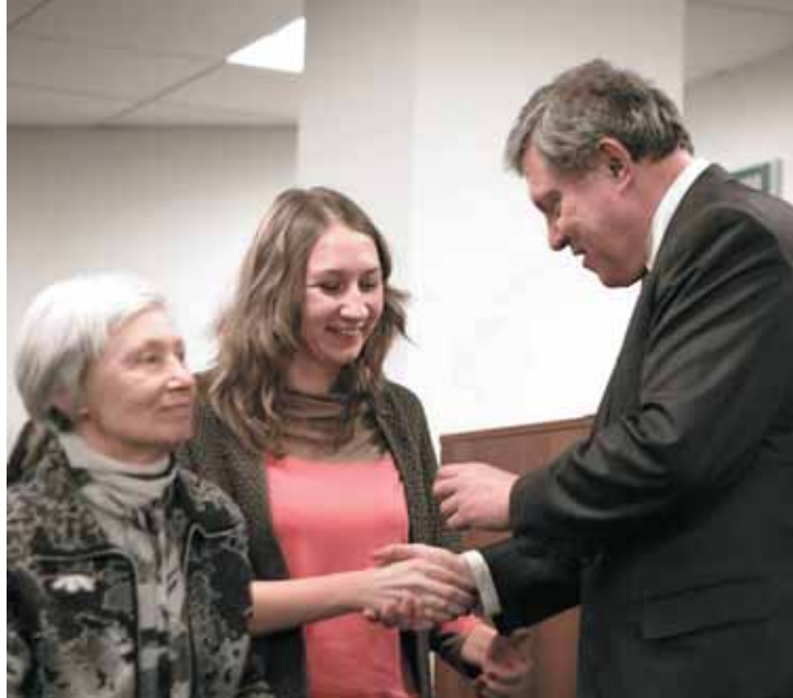
Григорий Явлинский вручает партийные билеты новым членам партии «ЯБЛОКО» на собрании в Санкт-Петербурге. Декабрь 2012 г.