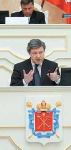
Г.А.Явлинский выступает на заседании Законодательного Собрания Санкт-Петербурга