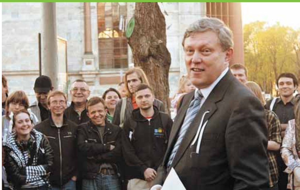
15 мая 2012 года. Григорий Явлинский выступает на Исаакиевской площади перед гражданскими активистами.