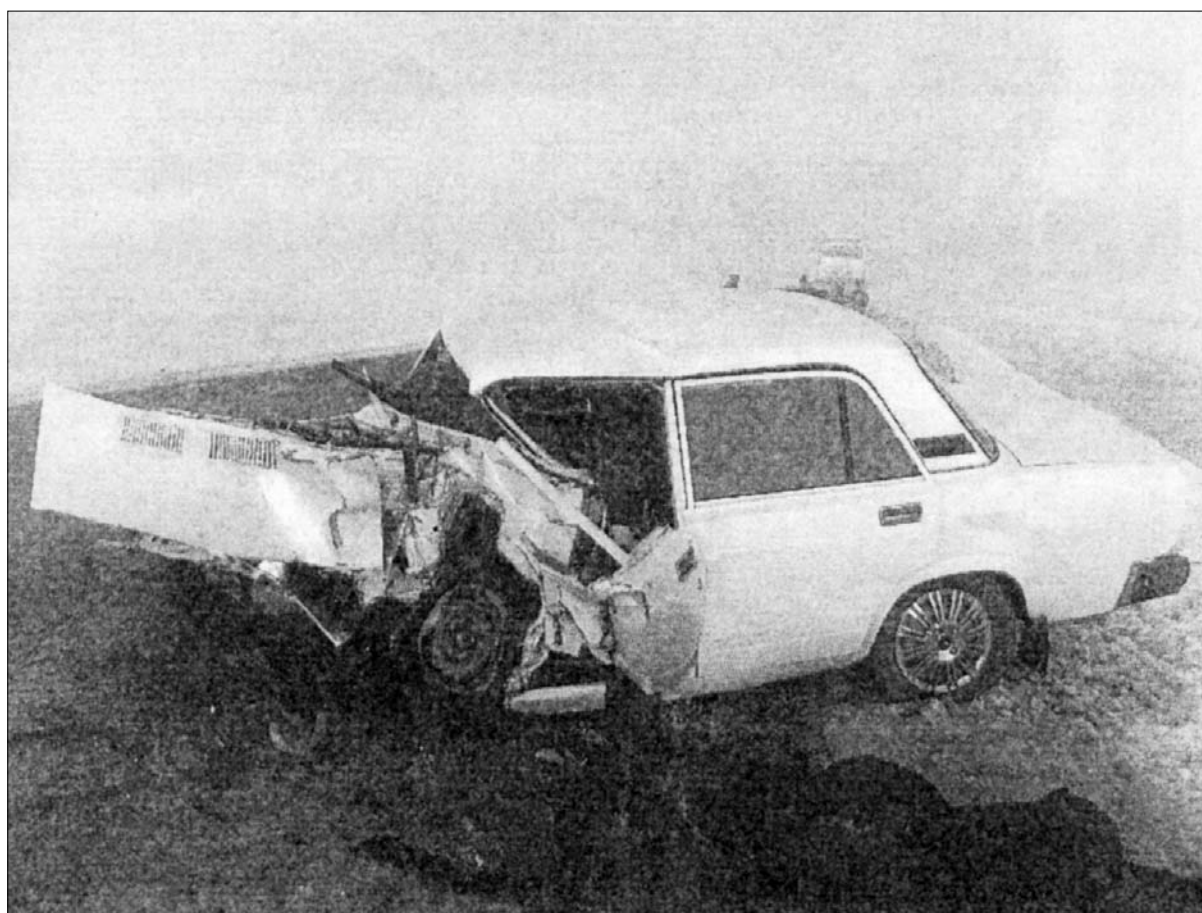
Илл.№5 общий вид левой стороны автомашины ВАЗ-2107, г.н. А 735 РУ 08 регион, (вид с южной стороны)

20 июля того же года судья Сарпинского районного суда Цымбалов Е.И. вынес постанов-