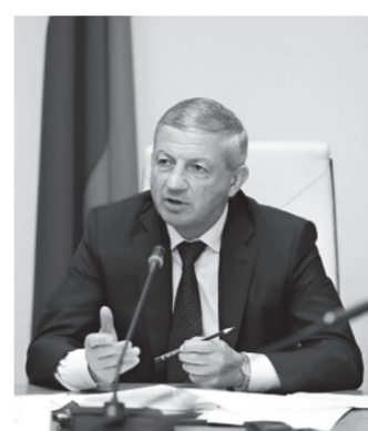
Глава Северной Осетии Вячеслав Битаров.