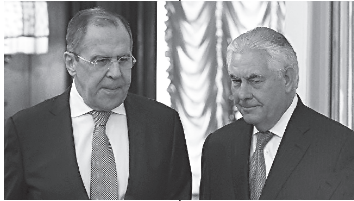
Между США и Россией по мировым вопросам.

Госсекретарь сказал, что многосторонние ограничительные меры будут действовать более эффективно