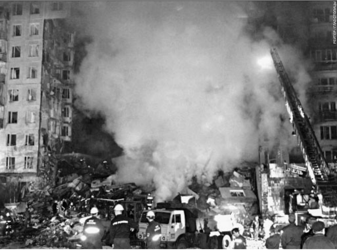
РЕЙТЕР / ГЛАЗ СТОЛИЦЫ

Мы считаем происходящее сегодня войной, объявленной народу России. Это — война бесчеловечная, изуверская. Это — война против спящих детей.