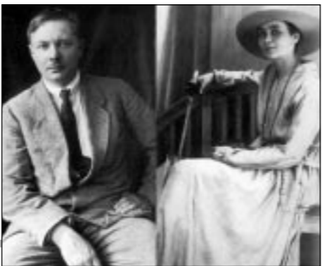
Линия персональная экспозиция после 1980-го года.

Сергей Дягилев открыл талант Михаила Ларионова. В 1906 г. Ларионов показал семь своих работ на выставке "Мир искусства", устроенной Дягилевым, и это было первой вершиной в карьере молодого художника. Дальше Ларионов двинулся сам. Начиная с выставки "Стефанос" в 1908 г. он сам был куратором своего успеха: не только писал картины, но и организовывал выставки, писал декларации, устраивал скандалы. Дягилев же был виновником того, что великодушная пара — Ларионов и Гончарова — покинула Россию. Сергей Дягилев и Игорь Стравинский пригласили их в 1915 году работать для "Русских балетов". В промежутке между этими датами — расцвет творчества Гончаровой и Ларионова.