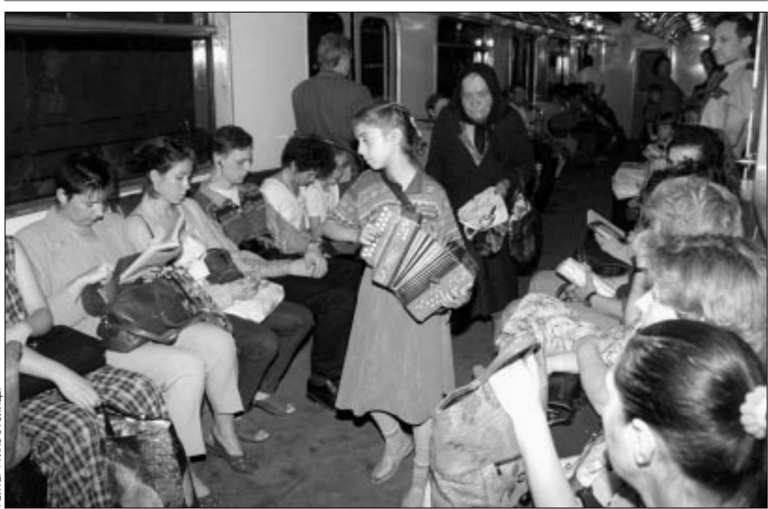
РЕЙТЕР / ГЛАС СТОЛБЫ

Капитализм, товарищи, это волчья стая. У кого есть ноги, тот и сыт в меру своей резвости, а у кого госбюджет, тот голодает: тихо-семейно или идейно-коллективно. Настоящее ремесло кормит всегда. А поскольку до сих пор спорят, слово было вначале или музыка сфер, то деревенская трехрядка или аристократический саксофон — не самое последнее по надежности средство добывания средств для существования в нашей непростой экономической ситуации. Пока правительство пребывает в глубоком миноре, на столичных просторах жизнь все мажорнее и мажорнее. Так музыка помогает выжить всем, да и помирить с ней, как известно, веселее. Но ведь мы помирять не собираемся — накоса выкуси! У нас просто переходный период.