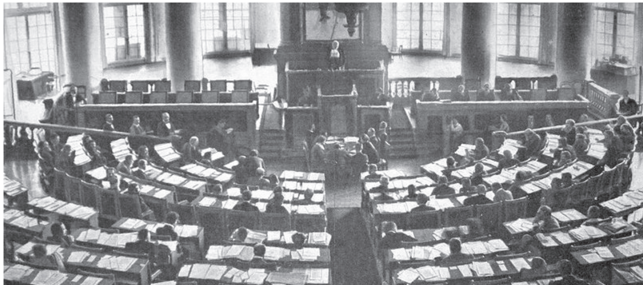
Зал заседаний Государственной Думы 1906-1917