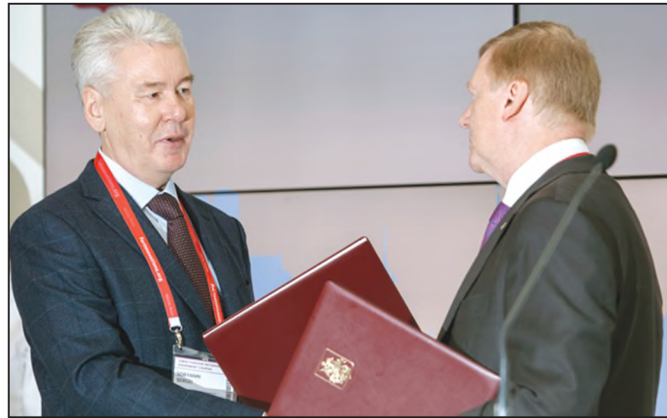
Собянин и Чубайс обмениваются папками с тайным соглашением на форуме «Открытые инновации».

сто окутываются отношения между региональной властью и организацией, живущей на бюджетные деньги.