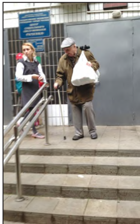
7 сентября 2013 г. Комментарии излишни. Организацией работы с пен-

Я полистал свой айпад и нашел вот эту фотографию: