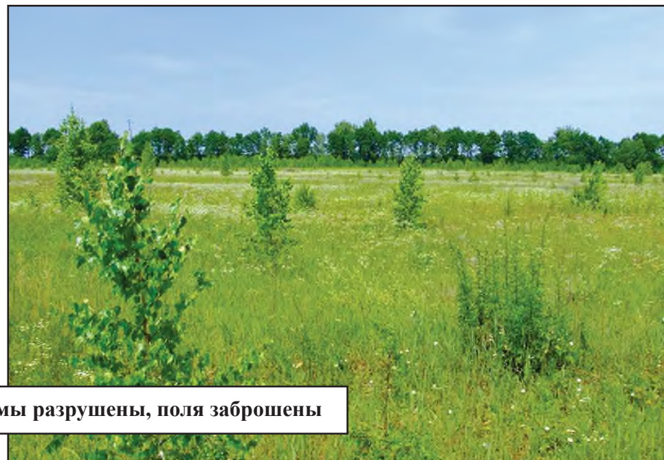
Реалии сегодняшней деревни: фермы разрушены, поля заброшены