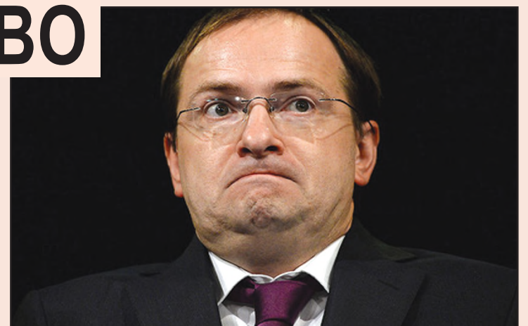
МИНИСТР КУЛЬТУРЫ РФ ВЛАДИМИР МЕДИНСКИЙ

«У нас с Вами могут быть разные представления о его деятельности на данном посту. Возможно, Вы не разделяете мое мнение о том, что культура в его представлении мало чем отличается от примитивной политической пропаганды. Но при этом я не сомневаюсь, что Вы согласитесь со мной в одном: министр культуры ни при каких обстоятельствах не может быть хамом», — завершает свое обращение к Дмитрию Медведеву лидер «ЯБЛОКА».