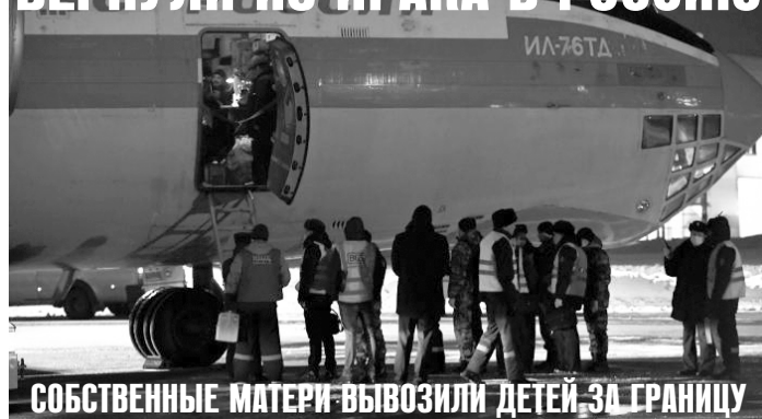
СОБСТВЕННЫЕ МАТЕРИ ВЫВОЗИЛИ ДЕТЕЙ ЗА ГРАНИЦУ

«На сегодняшний день из Ирака на Родину вернулись 57 несовершеннолетних российских граждан», - говорится в размещенном на сайте ведомства сообщении.