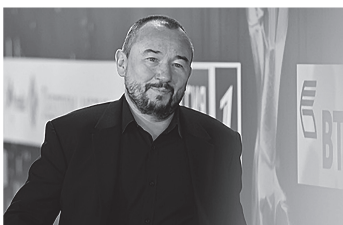
Ведущий Первого канала Артем Шейнин

«Действующие лица» на «России 1» Евгений Попов и Ольга Скабеева получают примерно по 12,8 миллиона рублей каждый. В издании подсчитали, что это доходы 150 пенсионеров на двоих. Их заработки складываются из двух источников: выплаты от телеканала «Россия», а также его главного госхолдинга ВГТРК.