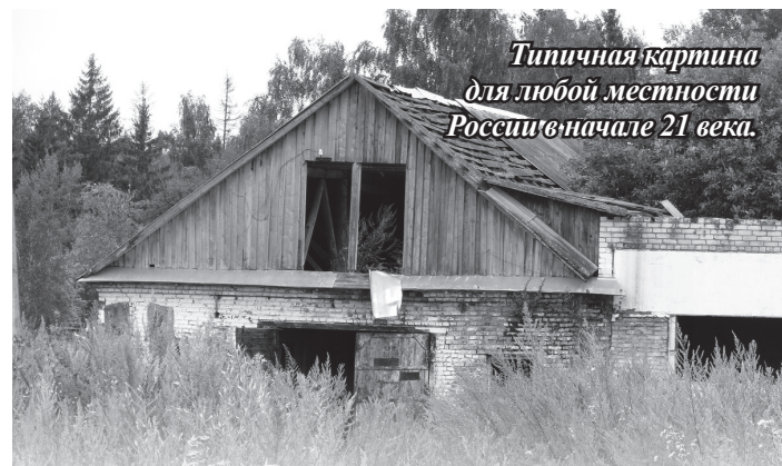
Типичная картина для любой местности России в начале 21 века.